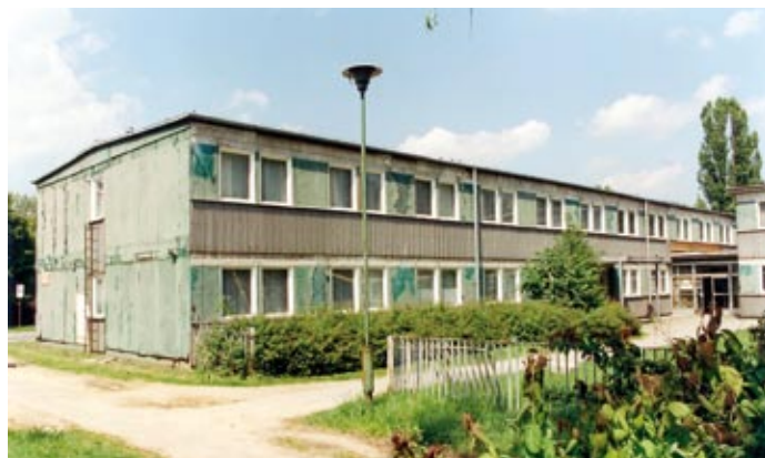
Przychodnia lekarska, lata 90.