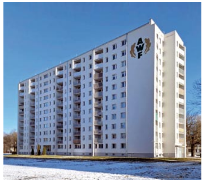
Dom rotacyjny 2026 r.

akademickim, przeznaczonym także dla młodej kadry asystenckiej. Z czasem, jako dom o przeznaczeniu hotelowo-mieszkalnym, przyjął nazwę „domu rotacyjnego”, znanym też jako „Rotak”. 6 maja 1979 roku gmach zwizytował I sekretarz Komitetu Warszawskiego PZPR, Alojzy Karkoszka. Powstawały także kolejne obiekty – pawilony administracji i biura projektowo-inwestycyjne, wykonywane przez warszawski Stolbud. Informuje o tym tablica z napisem: „Zespół pawilonów zaprojektowało i wybudowało w ciągu 10 miesięcy Zjednoczenie Przemysłu i Stolarki Budowlanej „Stolbud”, Warszawa 1979.”