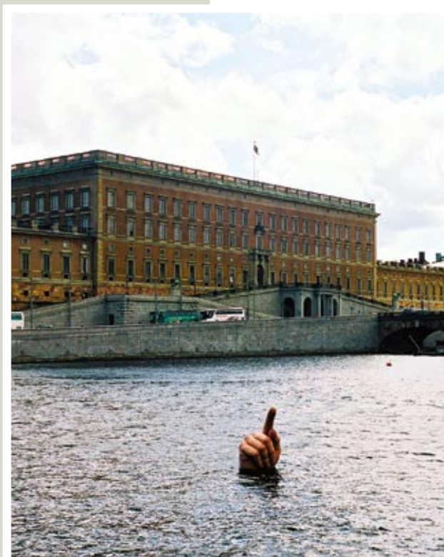
Zamek Tre Kronor, na pierwszym planie rzeźba-żart