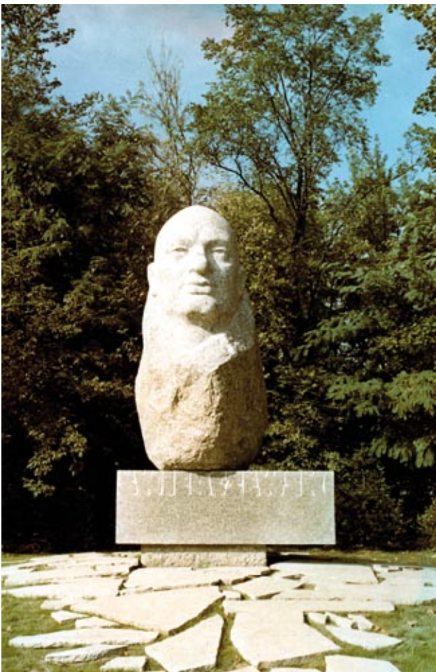
Pomnik Karola Świerczewskiego

Kolejny zespół pawilonów, tym razem konstrukcji NRD, wzniesiony został w technologii modułowo-kontenerowej. Pawilony mieściły przeniesioną z budynku akademika męskiego Przychodnię Sportowo-Lekarską AWF, (od 1983 roku Centrum Medycyny Sportu), bufet, sale wykładowe. Zielony kolor okładzin elewacji spowodował, że zwyczajowo budynek nazywano „zieleniakiem”.