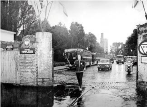
Brama AWF przed rozbiórką (1971 r.)