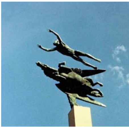
Człowiek i pegaz