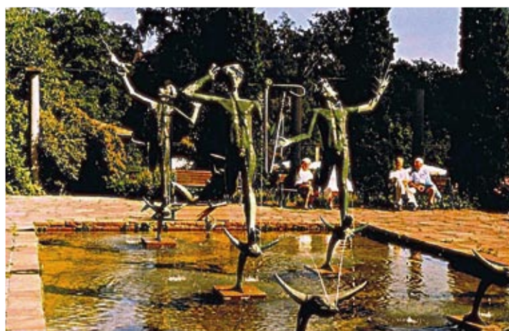
Nieliczni Sztokholmianie odpoczywają w ogrodach Millesa