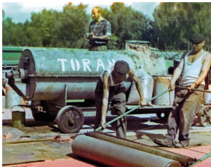
Pracownicy AWF przy kładzeniu eksperymentalnego toranu