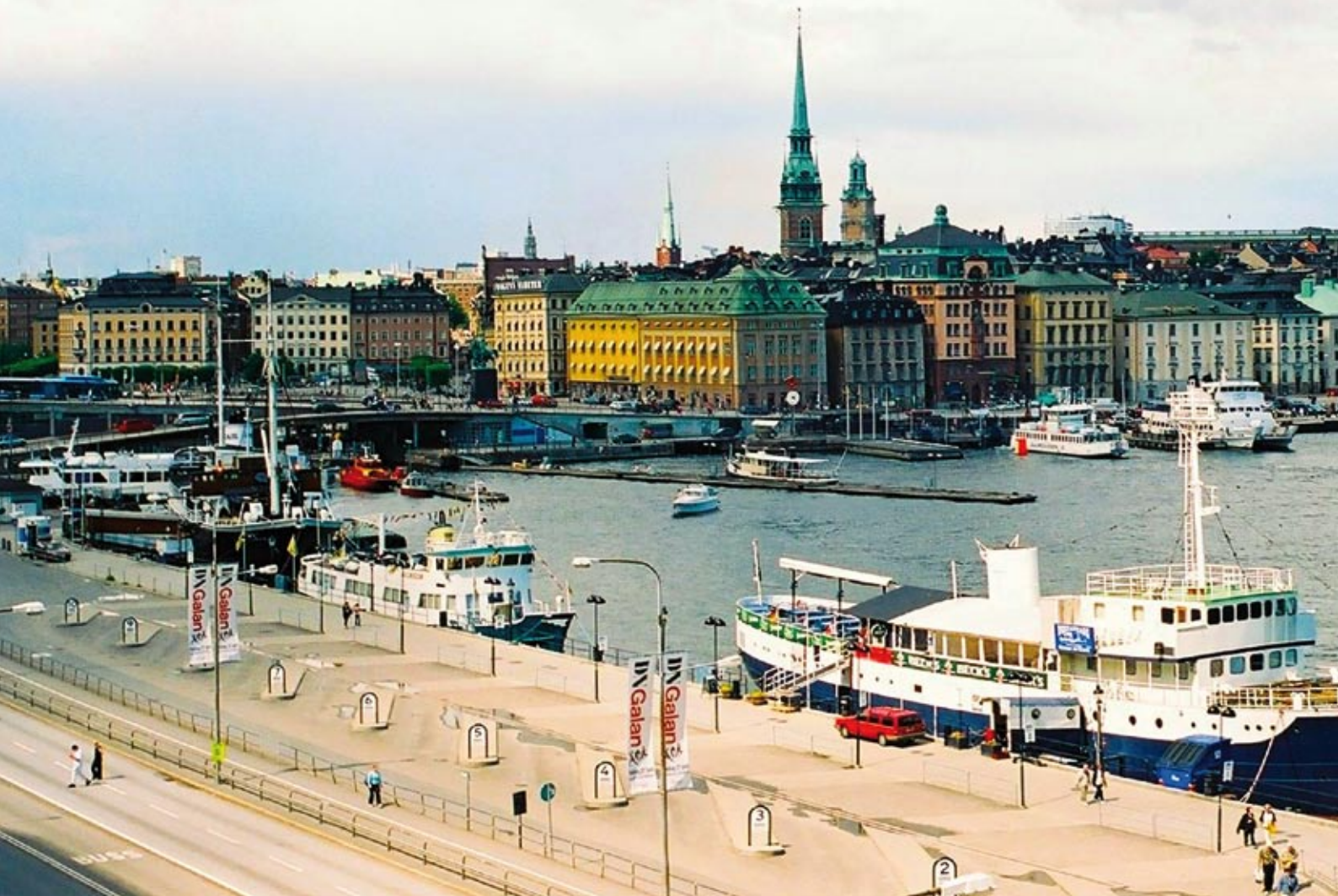
Widok na „Miasto między mostami”