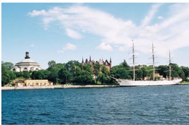
Imponujący żaglowiec zacumowany w centrum Sztokholmu

Oto górny taras, znajdujący się naprzeciwko budynku głównego. Zacieniają go w całości piękne sosny i brzozy, dzielą na