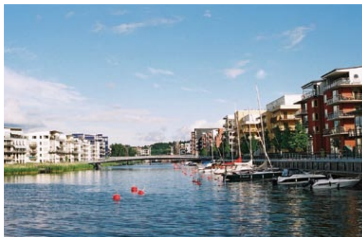
Dzielnica mieszkaniowa Johanneshov